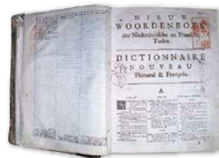
ハルマ『蘭仏辞典』第二版